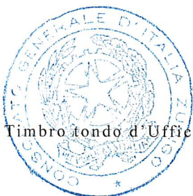
Timbro tondo d'Ufficio

IL PRESENTE AVVISO È STATO AFFISSO ALL'ALBO DI QUESTO CONSOLATO GENERALE D'ITALIA IN ZURIGO IL GIORNO 20 gennaio 2022